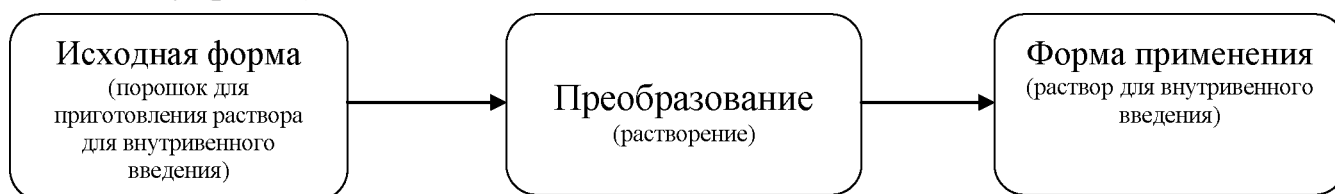
Рис.2 - Взаимосвязь между исходной формой и формой применения для лекарственных форм, требующих преобразований перед введением

Распространенным дополнительным элементом наименования лекарственной формы является признак готовности к применению. Данный элемент используется в случаях, когда лекарственная форма, в которой выпускается лекарственный препарат (исходная форма), отличается от лекарственной формы, в которой он непосредственно применяется (форма применения). То есть лекарственная форма требует проведения ветеринарным специалистом или владельцем животных дополнительного преобразования (например, растворения, разведения, диспергирования) с целью получения конечной лекарственной формы, пригодной для непосредственного введения животному (рис. 2).