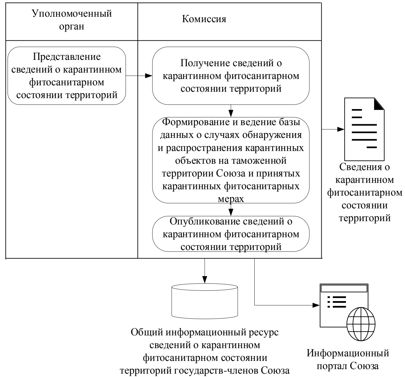
Рис. 4. Функциональная схема обмена сведениями о карантинном фитосанитарном состоянии территорий