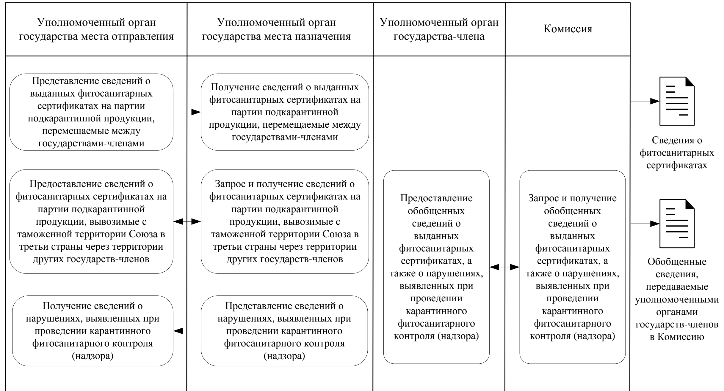
Рис. 1. Функциональная схема обмена сведениями о фитосанитарных сертификатах